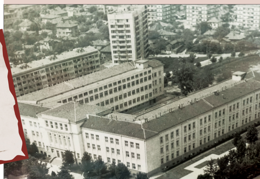
50 г. ПО-КЪСНО: Университет с 4 факултета, Медицински колеж, Департамент, 17 специалности, над 3000 студенти, 38 катедри.